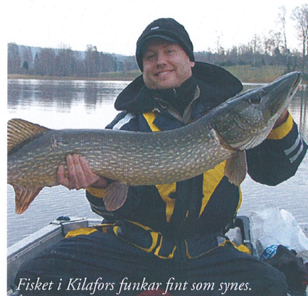
Fisken i Kilafors funkar fint som synes.

– Billigare blir det knappast men det kan vara skönt i kommunerna att veta att kalkningen fungerar i fyra år framåt till fasta men indexerade priser, påpekar Örjan Carlström.