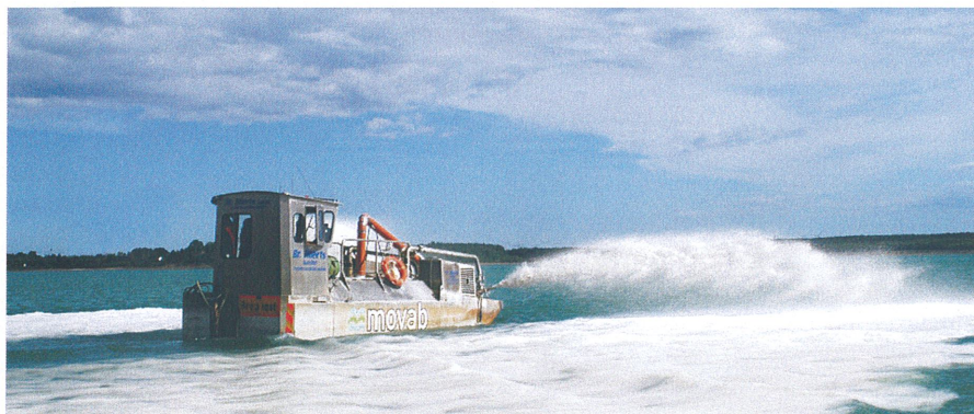
Bröderna Allert i spridartagen under högsäsongen på våren.